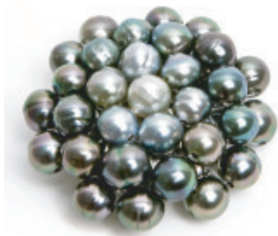
Brooch Just Pearls

EN TORNO A LA PERLA, hay los ensamblajes más hermosos. La sencillez de la materia unida en una infinita perfección para formar los collares de varias vueltas de perlas más bellos del mundo. Esa materia noble y sus maravillosas combinaciones crean piezas únicas con un brillo inefable.