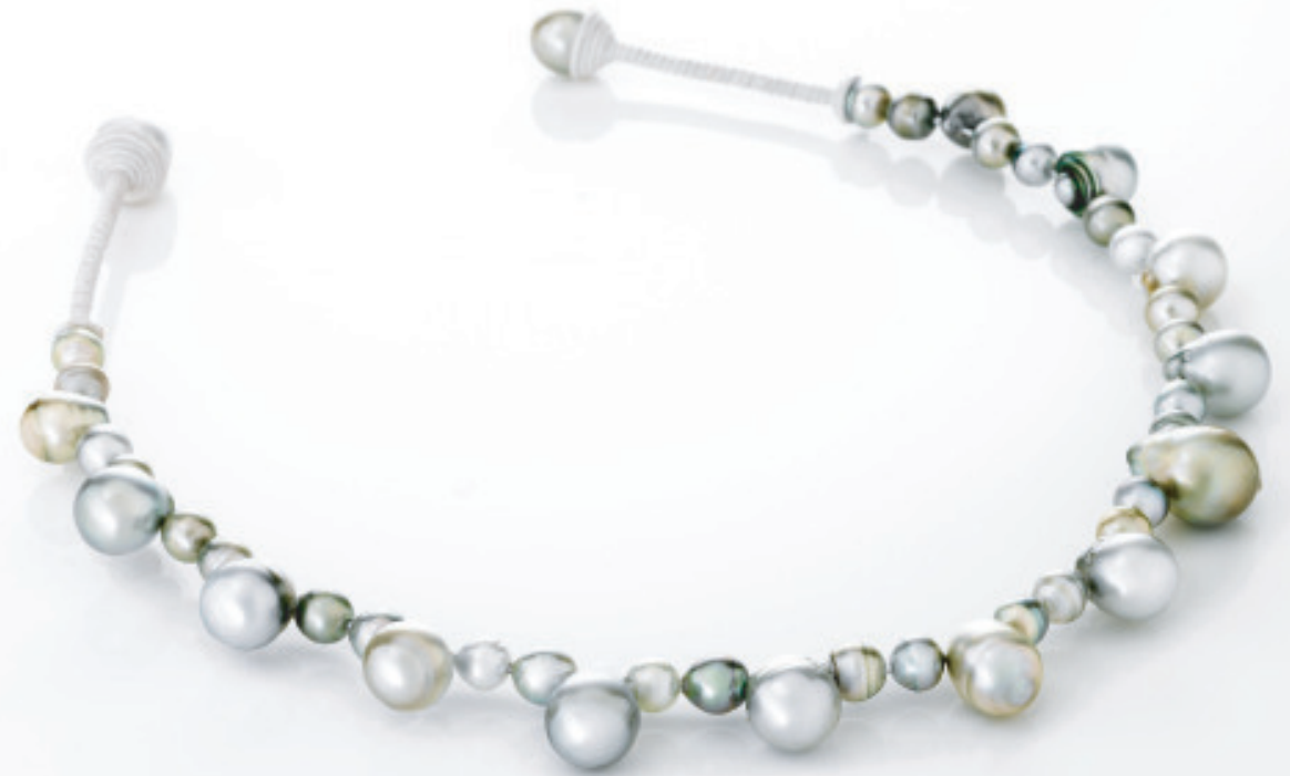
Tiara of Pearls