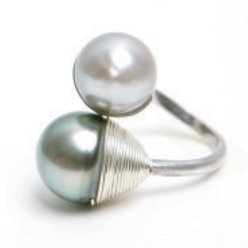
Two for One

EN TORNO DE LA PERLA, hay la celebración del amor, el compromiso de los seres y la eternidad de los sentimientos. Diadema por un día que aureola a la novia o collar por una noche de baile, una sale ataviada a cada instante de su vida.